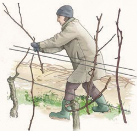
Tirage des bois

Le tirage des bois, également appelé « tombée des bois » ou « descente des bois », consiste à retirer du palissage les sarments coupés pendant la taille.