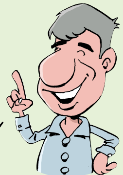
FORMATEUR EN MANAGEMENT

LE MANAGER PEUT FAILLIR, IL N'EST PAS SURHUMAIN. L'IMPORTANT EST DE POUVOIR SE REMETTRE EN QUESTION, ET CHERCHER À PROGRESSER.