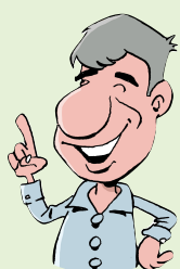
FORMATEUR EN MANAGEMENT

L'EMPLOYEUR A UNE OBLIGATION DE RÉSULTATS EN CE QUI CONCERNE LA SANTÉ ET LA SÉCURITÉ DE SES COLLABORATEURS.