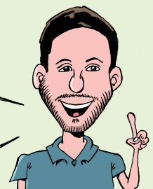
CONSEILIER EN PRÉVENTION MSA GIRONDE

L'ÉQUIPE PRÉVENTION DES RISQUES PROFESSIONNELS DE LA MSA GIRONDE EST À VOTRE SERVICE POUR VOUS ACCOMPAGNER DANS L'AMÉLIORATION DES CONDITIONS DE TRAVAIL.