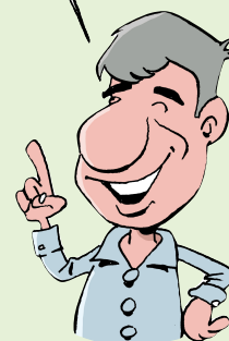
FORMATEUR EN MANAGEMENT

LE MANAGER FAIT PARTIE DE L'ÉQUIPE ! SA PRÉSENCE SUR LE TERRAIN ET SA PARTICIPATION À LA VIE DE L'ÉQUIPE SONT INDISPENSABLES.