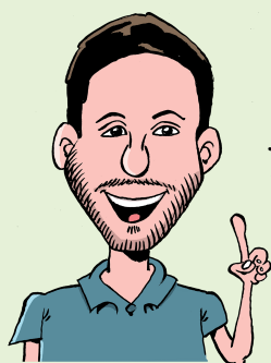
CONSEILLER EN PRÉVENTION MSA GIRONDE

ENCOURAGER LA SOLIDARITÉ ET L'ENTRAÏDE SERA BÉNÉFIQUE POUR L'ESPRIT D'ÉQUIPE.